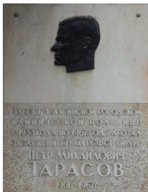
Рис. 3. Мемориальная доска, посвященная Тарасову П.М.